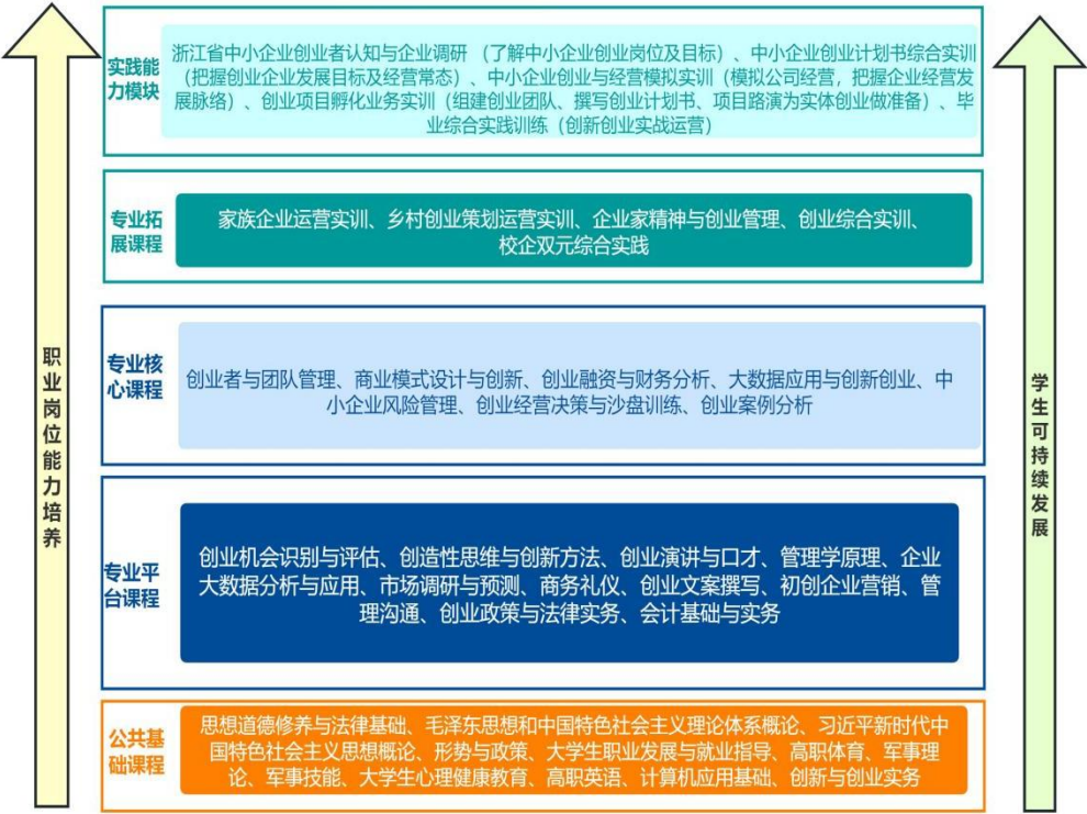
图 1 中小企业创业与经营专业人才培养模式

专业在产教融合办学方面依托省级双创示范基地、校外实训基地等实践教学平台实施课程综合实践（1-4 学期）、专业拓展课、毕业综合实践（5 学期）、毕业综合实践（6 学期）等综合性实践教学环节的校企双方共同育人的教学方式，以提高实践性技能的训练强度。